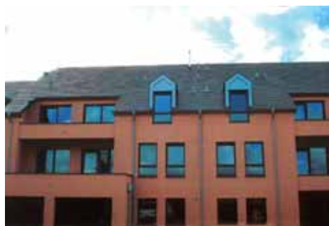
Ferienwohnungen: "Vakanzhaus Um Bill"