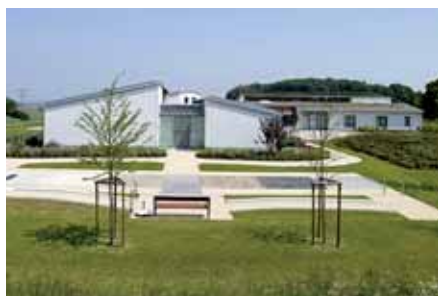
Tagesstätte: MS-Day Center Um Bill