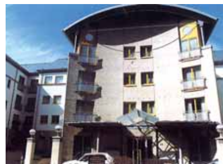
Résidence AL ESCH

17 Wohnungen für MS-Betroffene (seit 1996), im Zentrum von Esch-sur-Alzette.